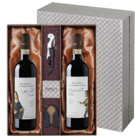
N-08 이태리 레오나르도 다 빈치 와인 다 빈치 끼안티 리제르바 다 빈치 끼안티