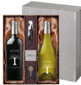
N-11 미국 캘리포니아 로다이 최고(最古) 와인 세트 올드 소울 카버네 소비뇽 올드 소울 샤도네이