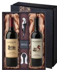
N-23 미국 추석엔 역시, 오리 와인 덕훈 덕훈 나파 밸리 카버네 소비뇽 덕훈 캔버스백 카버네 소비뇽