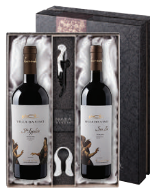
N-15 이태리 레오나르도다빈치서거500주년 기념 와인 다 빈치 산토 이폴리토 다 빈치 산 지오