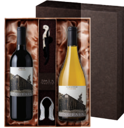
N-03 미국 캘리포니아 베스트 셀러 롱반 얼롯 롱반 샤도네이