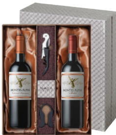
N-13 칠레 최고의 명성 몬테스 알파 카버네 소비뇽 몬테스 알파 멀롯