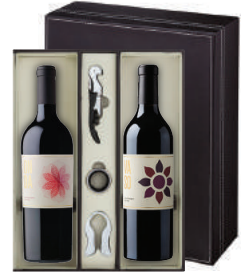
N-26 미국 바라는 소망이 그대에게 온다 다나 이스테이트 온다 다나 이스테이트 바소