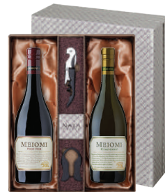
N-16 미국 캘리포니아 베스트 셀러 메이오미 피노 누아 메이오미 샤도네이