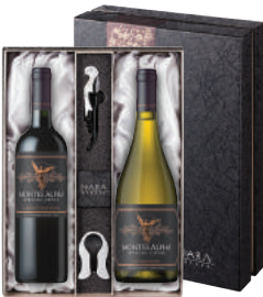
N-18 칠레 국민 와인의 진화 알파 블랙 라벨 몬테스 알파 블랙 라벨 카버네 소비뇽 몬테스 알파 블랙 라벨 샤도네이