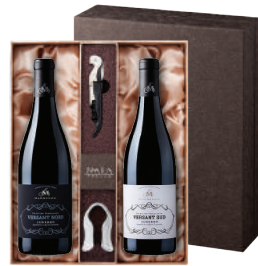
N-07 프랑스 남프랑스의 싱글 빈야드 마레농 베르상 노드 마레농 베르상 수드