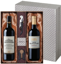
N-09 프랑스 프랑스 메독 세트 샤도 르파이라네, 메독 샤도 물랑 두 페이레, 메독