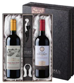
N-10 프랑스 프랑스 생떼밀리옹 세트 샤도 물랑 드 귀라, 푸쉬앵 생떼밀리옹 샤도 꼬드로이, 루쑤 생떼밀리옹