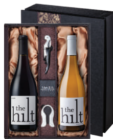
N-22 미국 스크리밍 이글의 새로운 비상(飛上) 더 힐트 이스테이트 피노 누아 더 힐트 이스테이트 샤도네이