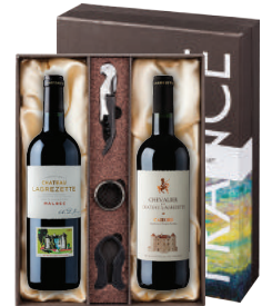
N-17 프랑스 까오르의 보석 샤도 라그레제트 슈발리에 뒤 샤도 라그레제트