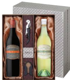
N-14 미국 케이머스의 시크릿 블렌딩 케이머스 코네티컷 레드 케이머스 코네티컷 화이트