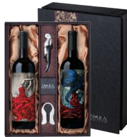
N-20 미국 천재 와인메이커가 만든 새로운 스타일의 레드 인트린직 카버네 소비뇽 인트린직 레드 블렌드