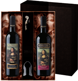
N-01 이태리 이태리 예술 와인 모나리자 로마냐 산지오베제 모나리자 몬테풀치아노 다브루쑤