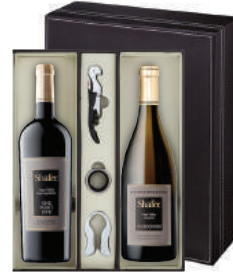
N-25 미국 황금빛 추석 쉐이퍼원 포인트 파이프 카버네 소비뇽 쉐이퍼샤도네이