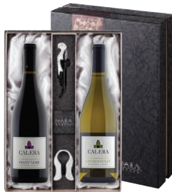
N-19 미국 캘리포니아의 로마네 콩티 칼레라 센트럴 코스트 피노 누아 칼레라 센트럴 코스트 샤도네이