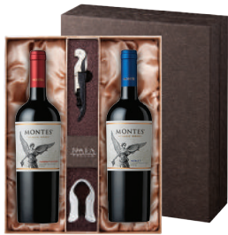
N-05 칠레 국민 와인의 정수 몬테스 클래식 카버네 소비뇽 몬테스 클래식 멀롯