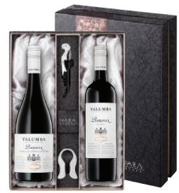
N-12 호주 호주 최고(最古)의 와인너리 알룸바 바로사 GSM 알룸바 바로사 쉬라즈