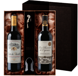
N-04 프랑스 프랑스 보르도 세트 귀베 뒤 슈발리에, 보르도 슈퍼리에 레 샤름 드 까프한, 보르도