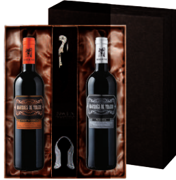
N-02 스페인 스페인 베스트 초이스 마르케스 데 톨레도 그란 레세르바 마르케스 데 톨레도 레세르바