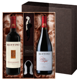
N-06 이태리 이태리 토스카나 대표 끼안티 루피노 일 레오 끼안티 수페리오레 루피노 토르가이오 토스카나 IGT