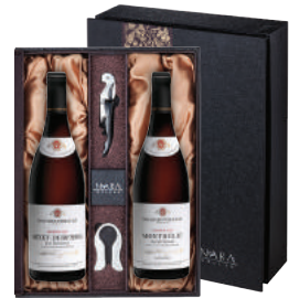
N-21 프랑스 부르고뉴 명가 1등급 세트 부샤 빼레 에 피스 오쎬 뒤레스 레 뒤레스 1등급 부샤 빼레 에 피스 몽텔리 레 뒤레스 1등급