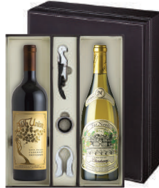
N-24 미국 Dolce Far Niente 파 니엔테 벨라유니언 카버네 소비뇽 파 니엔테 샤도네이